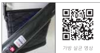
가방 살균 영상