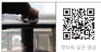
캣타워 살균 영상

기본 카메라 어플 또는 QR코드 리더기 어플을 통해 확인하실 수 있습니다.