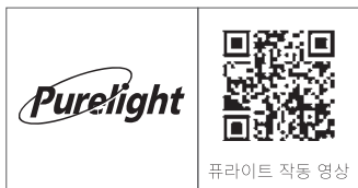
퓨라이트 작동 영상