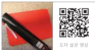
도마 살균 영상

도마 살균 시 퓨라이트를 5cm~10cm 띄우고 천천히 살균해 주세요. 나무나 플라스틱 도마는 자외선 투과가 되지 않으니 양면 살균을 추천해 드립니다.