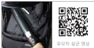
유모차 살균 영상

기본 카메라 어플 또는 QR코드 리더기 어플을 통해 확인하실 수 있습니다.