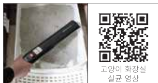
고양이 화장실 살균 영상

고양이 화장실의 세균과 바이러스 살균을 위해서 약 5cm~10cm를 띄우고 살균 소독해 주세요.