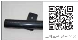
스마트폰 살균 영상

스마트폰 살균 시 퓨라이트를 밀착시켜주시고 10초 정도 비춰서 살균해 주세요. 자외선 투과가 되지 않으니 양면 살균을 추천해 드립니다.